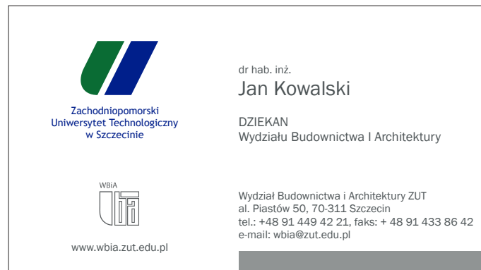
wizytówka 90 x 50 mm, skala 1:1